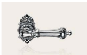
nero francese french black NF