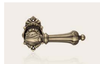
patiné patiné mat PM