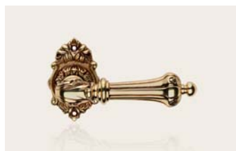
oro francese french gold OF