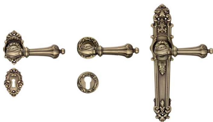
1590 RB 008