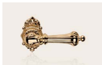
oro zecchino gold plated OZ